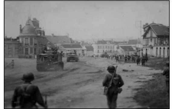
Libération de Coulommiers