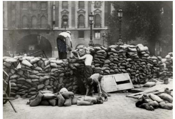
Barricade parisienne

Elle s'organisera autour de trois axes : la Résistance extérieure, la Résistance en France et la Résistance en régions ; des expositions temporaires complémentaires de l'exposition permanente ; un centre de documentation pour rendre accessibles directement les documents présentés dans les expositions et les réserves, faire connaître les fonds disponibles sur le sujet, inciter à la recherche et aux donations pour nourrir la recherche, etc.