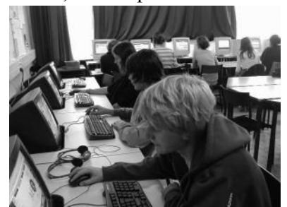
Séance de travail à Hazebrouck

Plusieurs dizaines de jeunes d'Ile-de-France, de l'Aisne, du Nord et de la Sarthe ont participé au projet : une quinzaine d'entre eux sont venus à la conférence finale qui s'est tenue à Florence. Pour la plupart, ils n'étaient jamais sortis de France et n'avaient jamais pris l'avion. Ils ont été heureux de rencontrer des jeunes Italiens et Litvaniens. Nous tenons à remercier les résistants qui ont accepté de participer au projet.