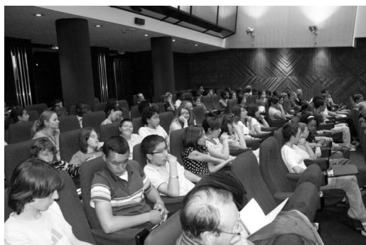
Elèves participants à la rencontre « valeurs » du 23 mai 2008

Plus de 130 classes ont participé à l'opération « valeurs de la Résistance, valeurs des jeunes aujourd'hui » en 2007-2008. La rencontre nationale des participants a eu lieu le 23 mai au conseil régional d'Île-de-France où plus de 200 personnes étaient présentes. Les élèves ont exposé leurs projets et échangé avec les enseignants et les résistants autour de leurs engagements et sur les améliorations possibles de l'opération. Cela a été pour les équipes pédagogiques et les résistants l'occasion de renouveler leur volonté de s'investir dans l'opération.