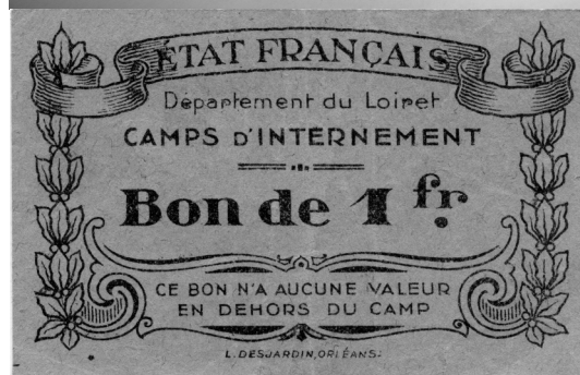
- Sabots confectionnés au camp de Pithiviers. - Bon de 1 franc du camp de Pithiviers.

Des bulletins d'adhésion à l'A.E.R.I. dont disponibles sur demande au 01.45.66.62.72 ou sur notre site internet: www.aeri-resistance.com